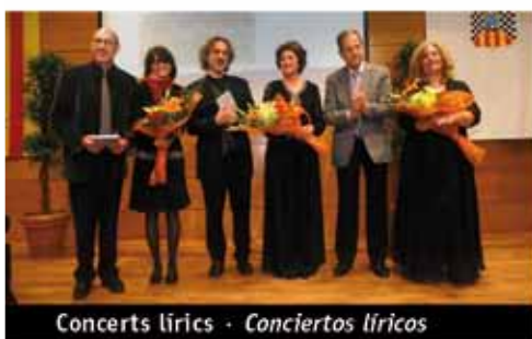
Concerts lírics · Conciertos líricos