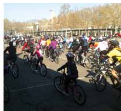
Pedalada EKKE · Pedalada EKKE