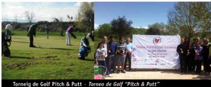
Torneig de Golf Pitch & Putt · Torneo de Golf "Pitch & Putt"