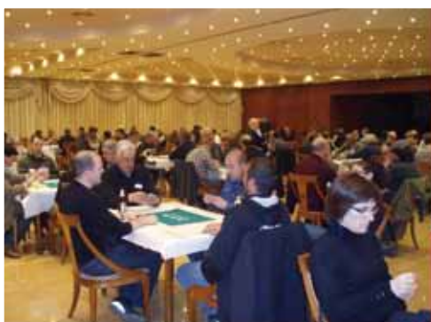
Campionats de botifarra · Campeonatos de "botifarra"