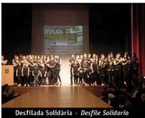
Desfilada Solidària · Desfile Solidario