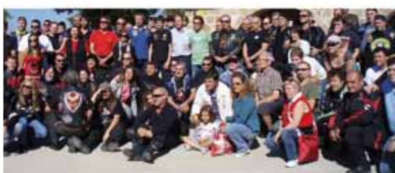
Trobada motard a Tiurana · Encuentro motard en Tiurana