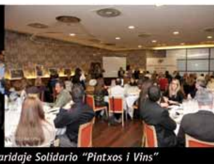
Maridatge Solidari Pintxos i Vins · Maridaje Solidario "Pintxos i Vins"