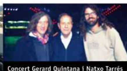
Concert Gerard Quintana i Natxo Tarrés Concierto Gerard Quintana y Natxo Tarrés